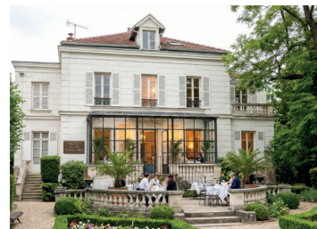
Maison Schœlcher : lieu de culture