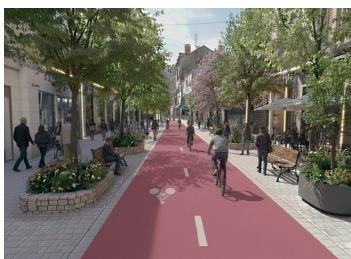
Piétonnisation avenue Charles-de-Gaulle et parking souterrain