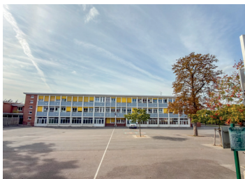
Rénovation thermique des écoles