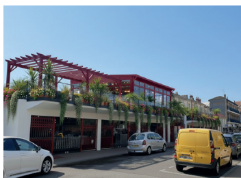
Espace buvette et créateurs