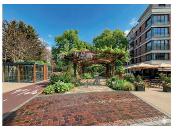
Friche de la gare