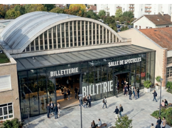
Salle de spectacle