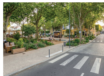
Végétalisation de la place du 14 juillet