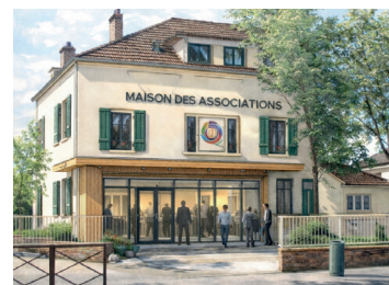
Maison des associations