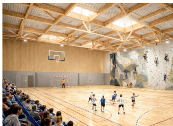
Construction d'un gymnase